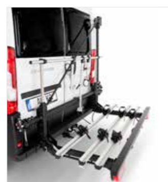
Set-up kit voor 3 e-bikes of fietsen