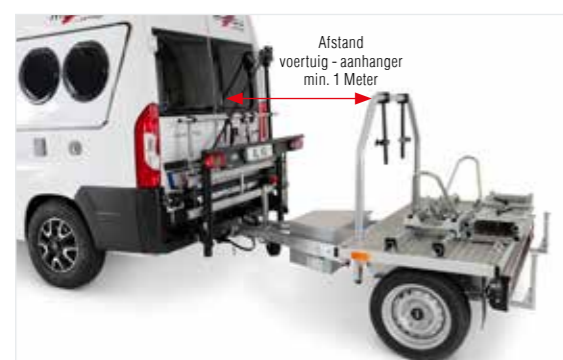
Trekhaak kan zonder beperkingen worden gebruikt