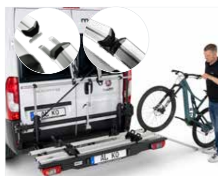
Comfortabel laden, ook via een oprijplaat